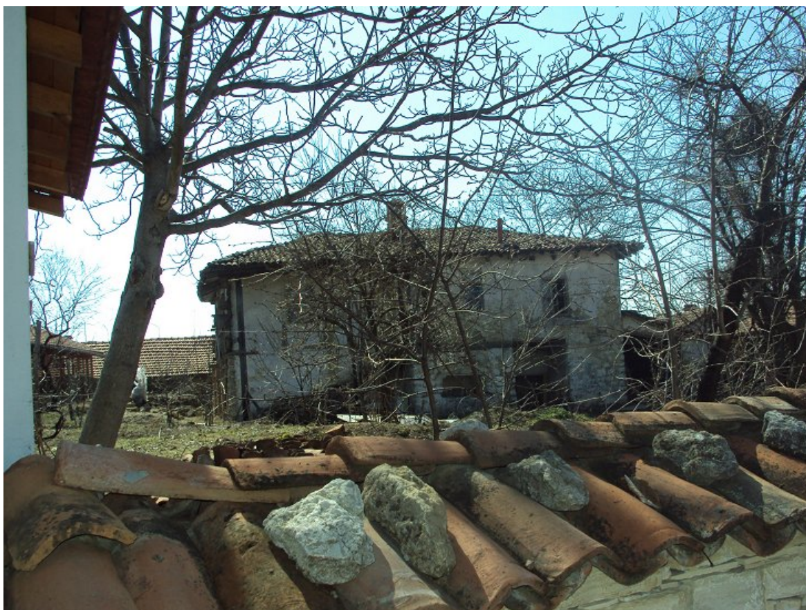
Фотография 1. Къщата на Завета. Вид от север.

„Къщата на Завета“ е купена от Бялото братство. Повече за историята и можете да видите в един доста интересен видеоклип, заснет от братството и качен в Youtube [22]. Ваня Вергова също ми изпрати фотографии, които са приведени по-долу. Къщата е на около 300 г. и е в доста лошо състояние. Доколкото се разбира от сайта на братството, в момента, по повод на 100 годишнината на книгата тече кампания за събиране на средства за построяването на нова къща на Завета. Необходимата минимална сума е 100 000 лева [20].