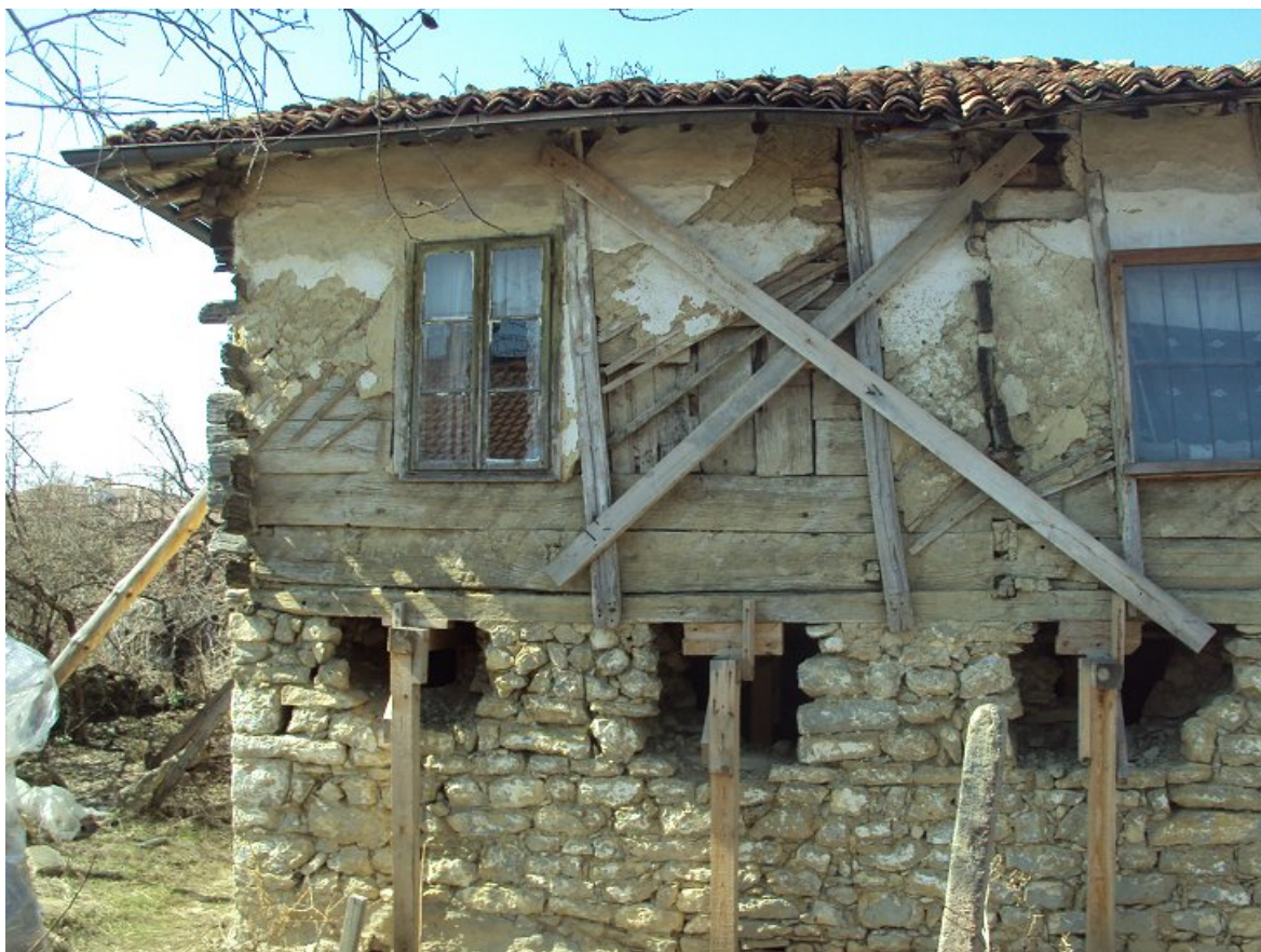
Фотография 2. Къщата на Завета. Вид от изток.