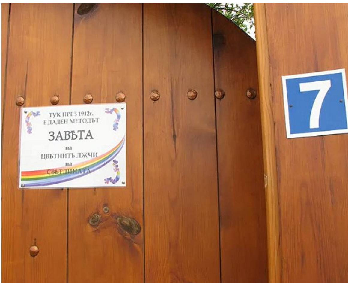
Фотография 3. Входната врата на къщата на Завета.

За молитвата, песента и този текст имаме 5,6 минути, но не повече от 10 мин. .... Според скромното ми мнение отправната точка на астрологичното проучване на книгата ще да е мястото и времето на прочитане. Не само защото намерих най-много материал, но и защото СЛОВОТО е слово когато е било говорено. И Христос не си е водил записки, нито е писал, а е ГОВОРИЛ. Така и Учителят Беинса Дуно. Говорил е, имал е три стенографки и т.н“. [9]